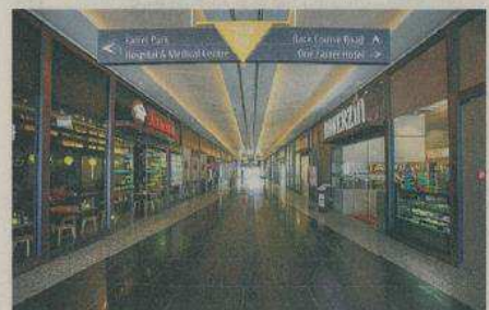
Owen Link餐饮街提供多样化餐饮选择。