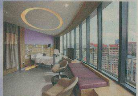
斐瑞医院病人套房空间宽阔。

世界各地的游客飞来新加坡，不仅为了购物、美食，更为了看病。除了乌节路、诺维娜，靠近小印度的花拉公园将成为新兴的医疗中心。