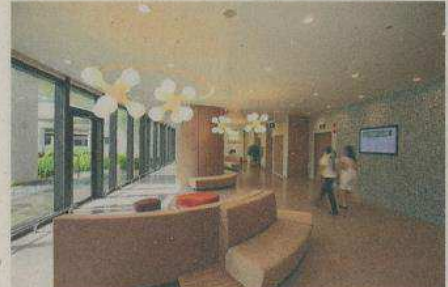
Connexion装潢设计像酒店多过医院。