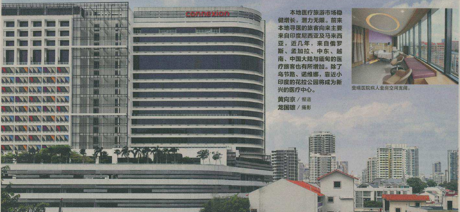
花拉公园地铁站外的Connexion大厦引人注目，自去年底起，为医疗游客提供一站式服务。

本地医疗旅游市场稳健增长，潜力无限。前来本地寻医的旅客向来主要来自印度尼西亚及马来西亚，近几年，来自俄罗斯、孟加拉、中东、越南、中国大陆与缅甸的医疗旅客也有所增加。除了乌节路、诺维娜，靠近小印度的花拉公园将成为新兴的医疗中心。